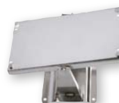
Art. 9764 Art. 9765