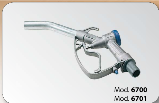
Mod. 6700 Mod. 6701